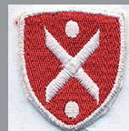
↑ neues „Thor Steinar“ Logo