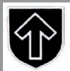
← Abzeichen der 32. SS-Division „30. Januar“

Das Erfolgsrezept von Thor Steinar baut vor allem darauf, dass die Motive eindeutig zweideutige Aussagen haben, die dazu geeignet sind, rechtes Gedankengut zu transportieren. Die hintergründigen Bedeutungen erschließen