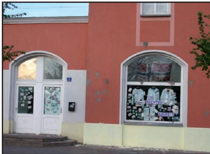
Nicht bei allen beliebt: Der „Nordic Company“ am Bahnhofplatz 3.

Die Gäste waren hauptsächlich unorganisierte Neonazis aus Frankfurt (Oder). Aber auch aus der näheren Umgebung, beispielsweise aus Fürstenwalde/Spree, verbrachten Neonazis ihren Abend an Wochenenden in der SK, darunter auch NPDler. Von Anfang an gehörten auch die jungen Hooligans des „FC Vorwärts“ zur Stammkundschaft. Abgesehen von zahlreichen durch Schlägereien bedingten Hausverboten ihrer Protagonisten in anderen Frankfurter