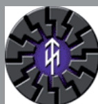
← Emblem des rechtsintellektuellen Thule-Seminars